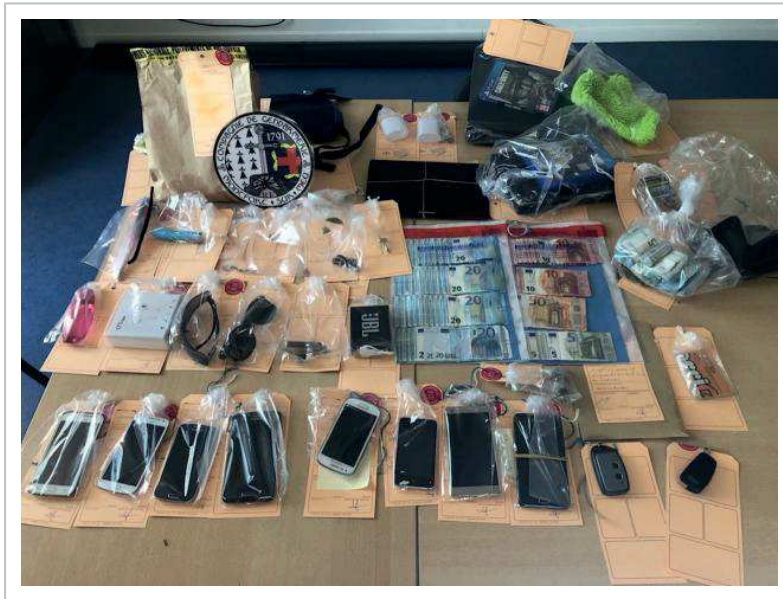
Le butin des cambrioleurs saisi par les gendarmes

ouest-france.fr, mercredi 10 juillet 2019, 410 mots