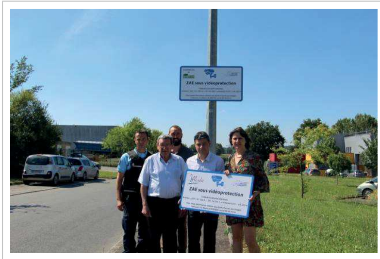
Les élus et la gendarmerie installent une vidéosurveillance des parcs d'activités de la Corderie, à Iffendic, et de la Nouette, à Montfort-sur-Meu.

ouest-france.fr, vendredi 5 juillet 2019, 318 mots