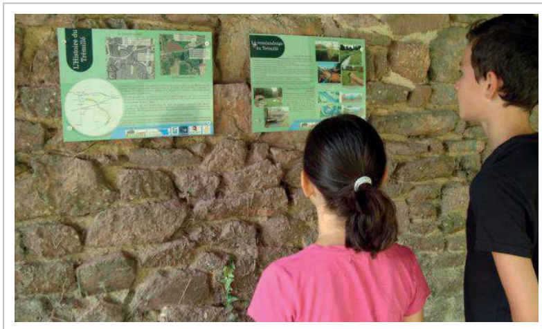
Des panonceaux d'information sur la restauration du Trémillé sont affichés au lavoir du Pont-Liard

Grâce à l'acquisition de terrains par la commune, un autre cheminement pourra voir le jour dans la partie amont du Trémillé, à partir du Pont-Liard.