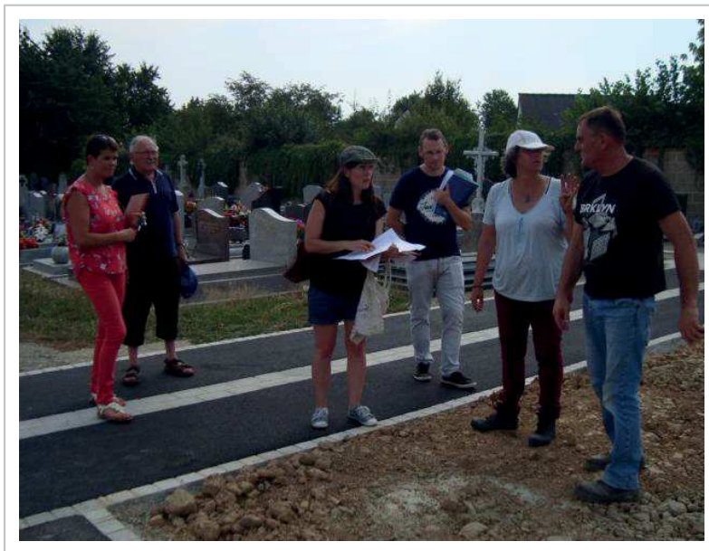
Réunion de chantier avec les élus, la société Folk Paysage et la marbrerie Demay.