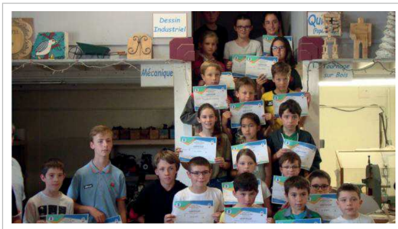
Les enfants ont reçu leur certificat.

Quotidien Ouest-France, ouest-france.fr, mardi 2 juillet 2019, 267 mots