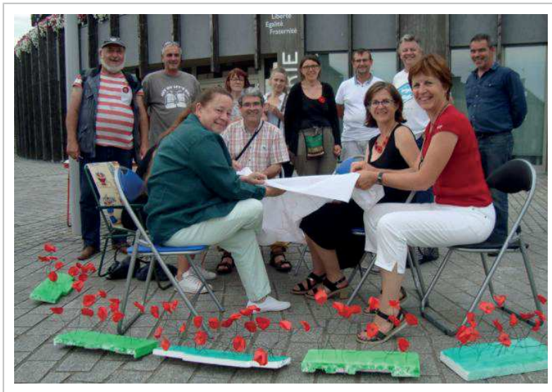
Le collectif Nous voulons des coquelicots à Breteil et partout, réuni autour de sa future banderole.