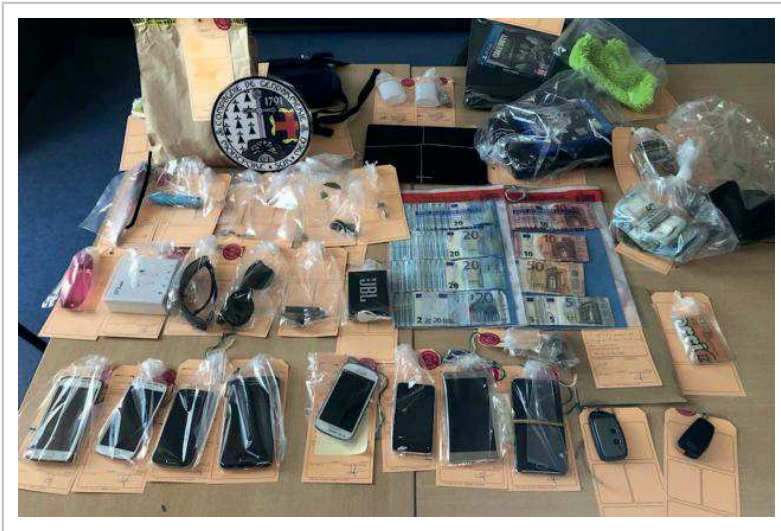
Le butin des cambrioleurs saisi par les gendarmes