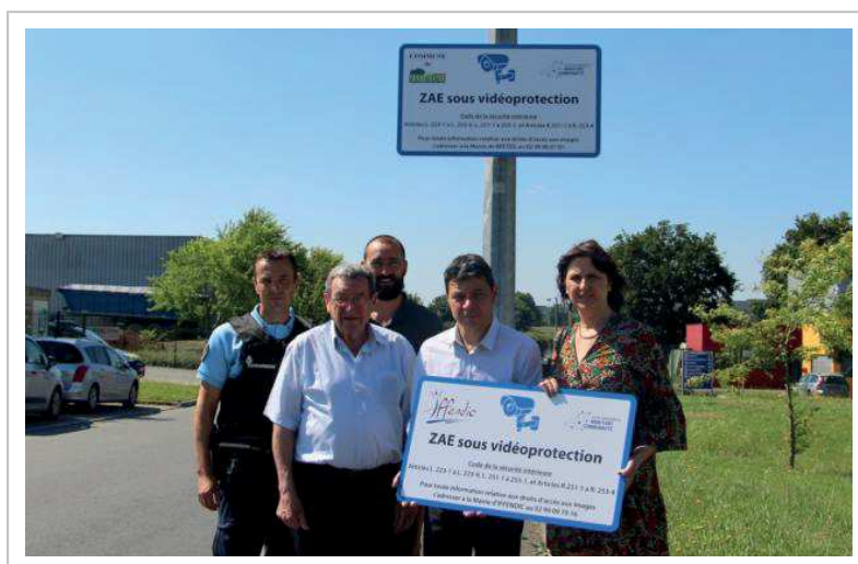
Les élus et la gendarmerie installent une vidéosurveillance des parcs d'activités de la Corderie, à Iffendic, et de la Nouette, à Montfort-sur-Meu.

La consultation des données pour les besoins d'enquête de la gendarmerie ne pourra être effectuée que par du personnel communal ou des élus des communes. Le coût de l'opération s'élève à 10 700 € HT pour les deux sites.