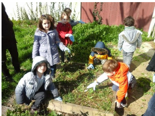
Les beaux jours sont de retour et l'atelier jardinage aussi...