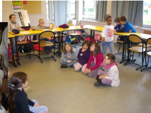
Atelier Jeux et créations à travers l'Europe