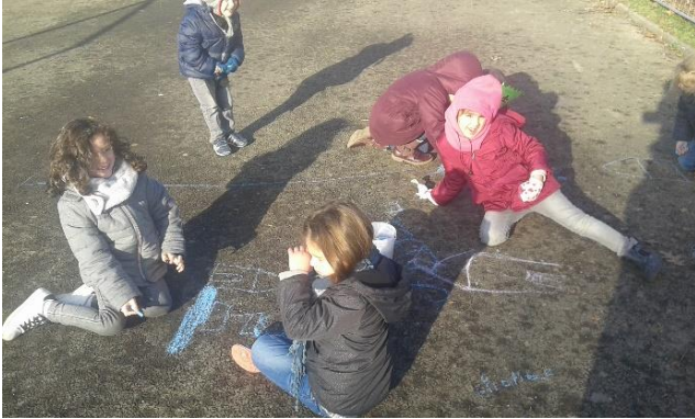
On profite du soleil...