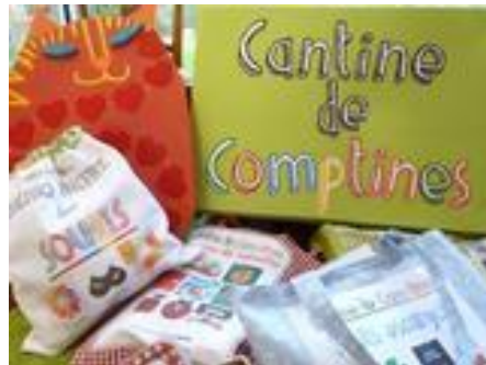
A la Médiathèque nous lisons et jouons avec La Cantine des Comptines