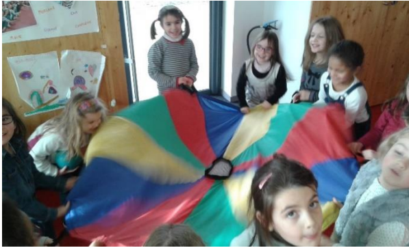
Jeu collaboratif du parachute : collectivement, les enfants doivent faire rebondir une balle, sans qu'elle ne tombe par terre.