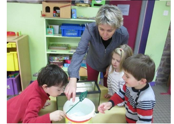
On observe et on prend soin de nos 5 petits poissons.