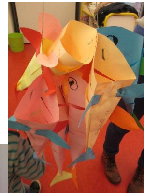
On a fait de nombreuses activités manuelles (calamars géants, poissons, danseuses, cartes de vœux...).