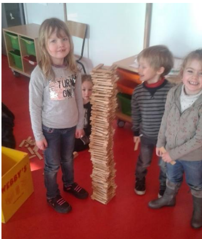
Construction de tours en Kaplas.