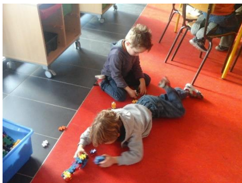
Jeux de construction