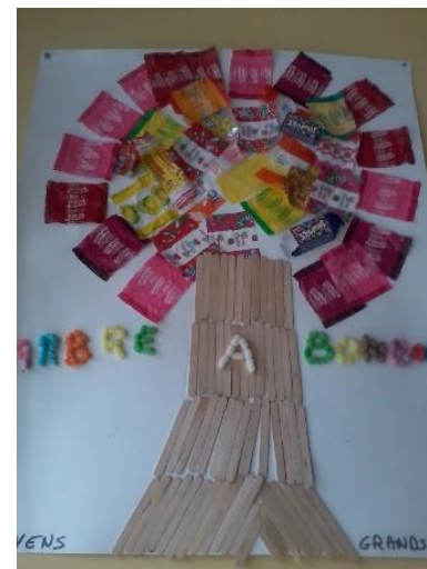
L'arbre à bonbons