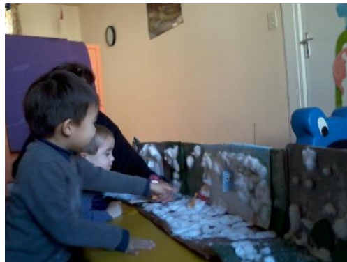
Lili la souris revient chaque jour raconter des histoires dans un cadre enneigé.