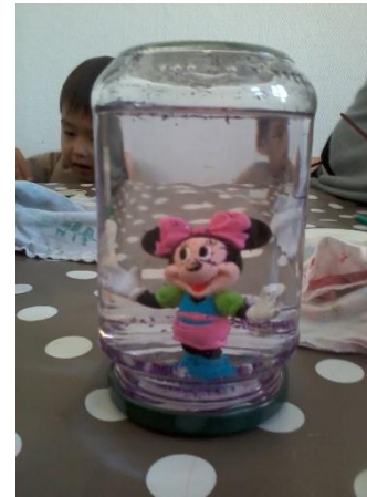
Boule de neige fabriquée par les enfants.

Réalisation d'une grande fresque collective.