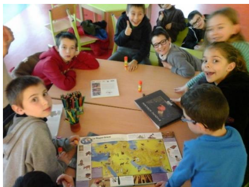
Atelier « Voyage autour du monde »