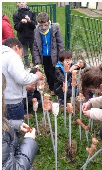
Création d'un village en argile auto-durcissante lors de l'atelier Céramique