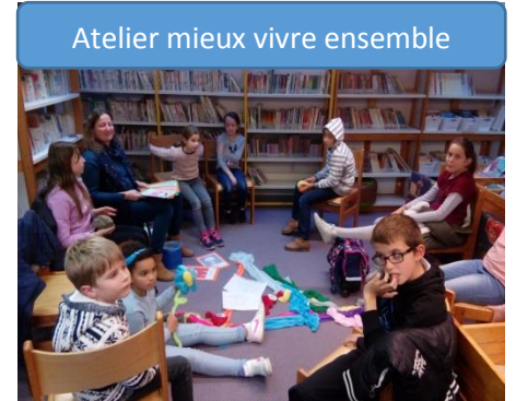
Atelier mieux vivre ensemble