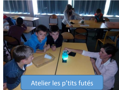
Atelier les p'tits futés