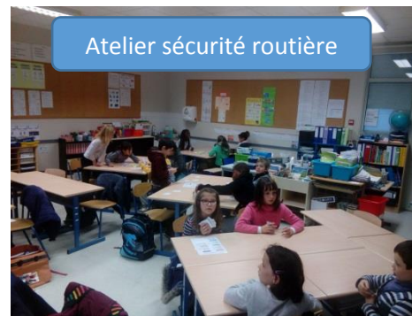
Atelier sécurité routière