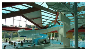
La piscine Océlia