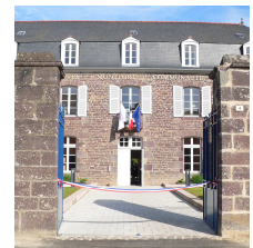
L'Hôtel Montfort Communauté

Site internet : http://www.montfortcommunaute.bzh